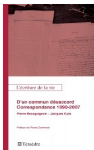
D'un commun désaccord. Correspondance 1990-2007