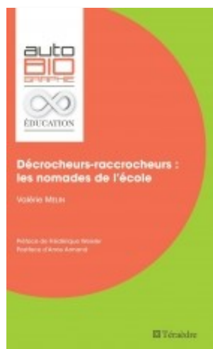
Décrocheurs-raccrocheurs. Les nomades de l'école