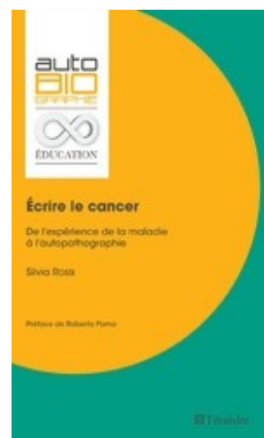
Écrire le cancer. De l'expérience de la maladie à l'auto-pathographie