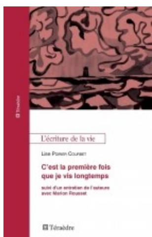
C'est la première fois que je vis longtemps