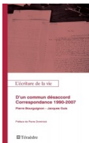
D'un commun désaccord. Correspondance 1990-2007