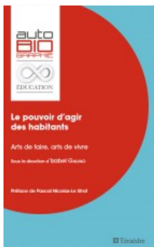
Le pouvoir d'agir des habitants. Arts de faire, arts de vivre