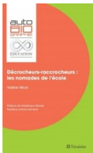
Décrocheurs-raccrocheurs. Les nomades de l'école