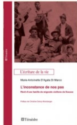
L'inconstance de nos pas. Récit d'une famille de migrants siciliens de Sousse