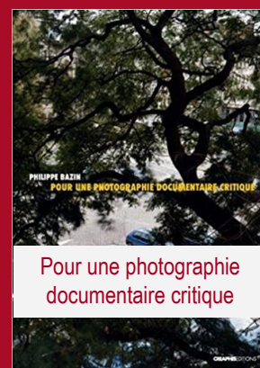
Pour une photographie documentaire critique