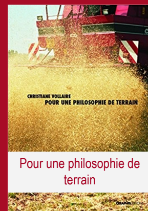
Pour une philosophie de terrain