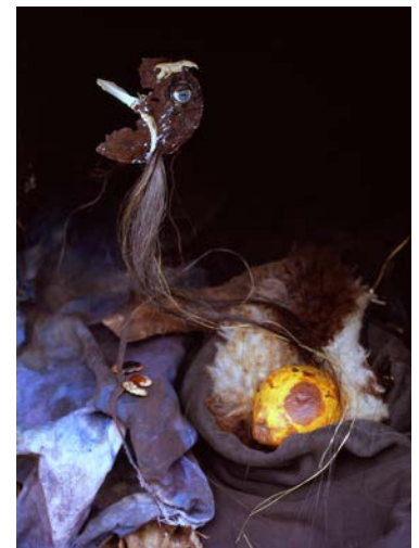
L'une grêle, le devenir, Berlin 2012, Chromogenic Print (30 x 40 cm)