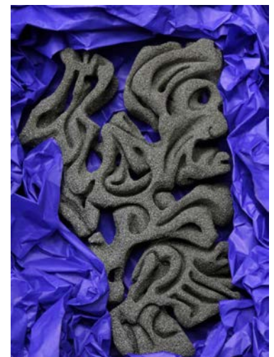
Initial I, Berlin 2015, Sculpture en pierre ponce (25 x 40 cm)