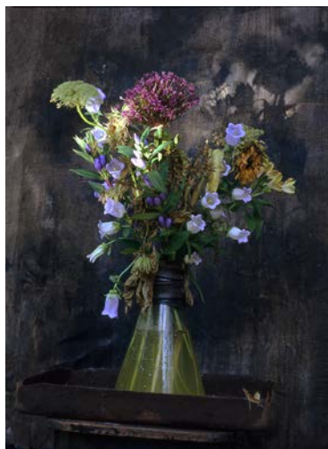
Bewegtes Leben V, Berlin 2012, Chromogenic Print (30 x 40 cm)