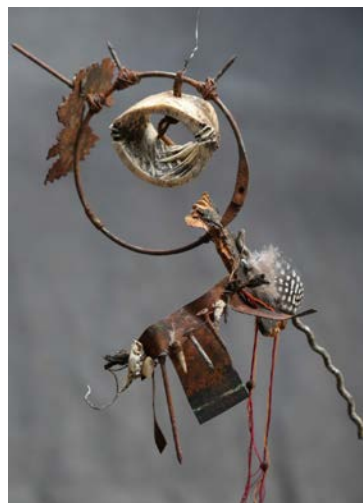
Kickema, Berlin 2015, sculpture mixed media (32 x 25 cm)