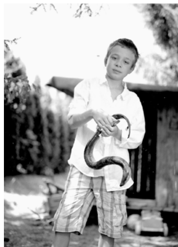
Zeno, Nötsch 2013, Chromogenic Print (30 x 40 cm)