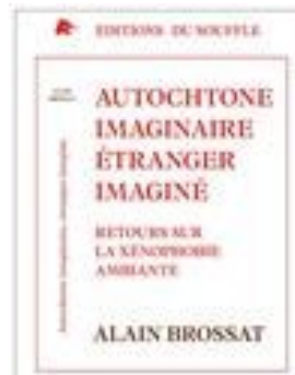
Autochtone imaginaire, étranger imaginé.