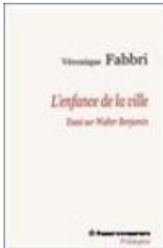
L'enfance de la ville Essai sur Walter Benjamin